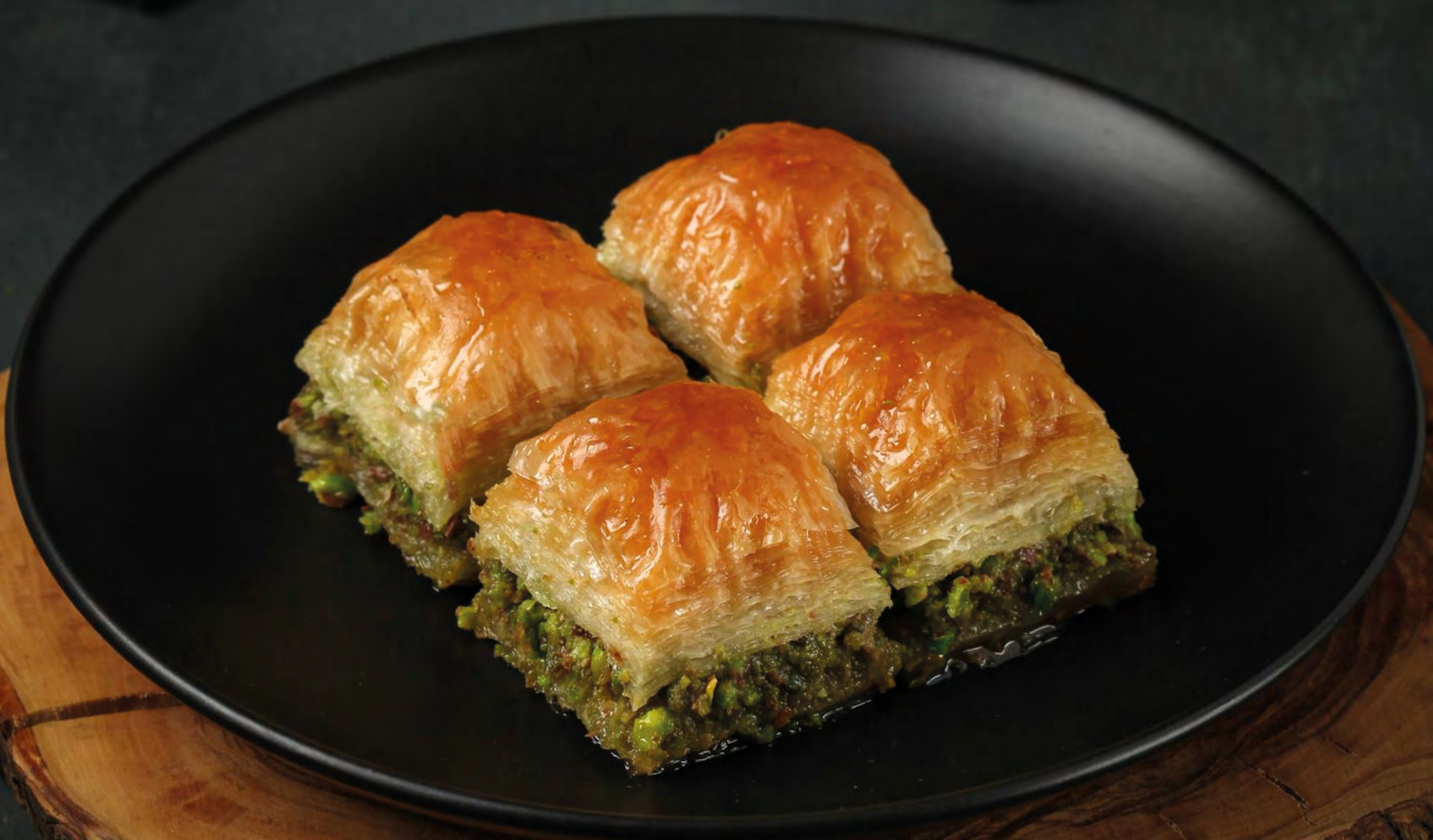
Special Square Baklava With Pistachio