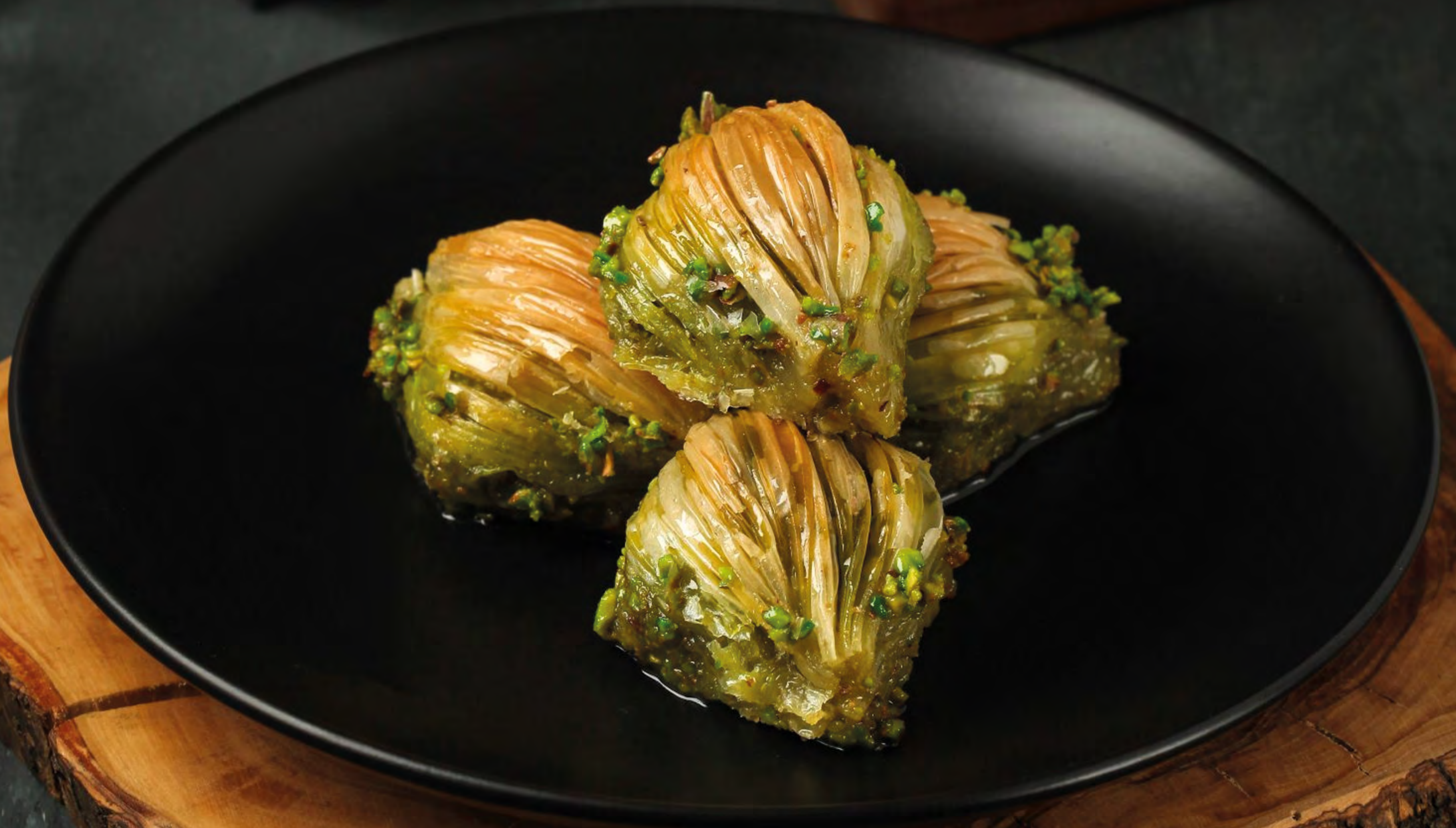
Midye Baklava With Pistachio